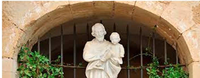
Monastère Saint-Joseph du Bessillon à Cotignac

Dans sa dernière lettre apostolique, « Patris corde » -avec un cœur de père, le pape François nous donne Saint Joseph comme « soutien et guide dans les moments de difficultés. » Tout au long de l'année, nous découvrirons les différentes facettes de cette « figure extraordinaire » : ce descendant de David à qui Dieu va confier la Vierge Marie et son fils Jésus.