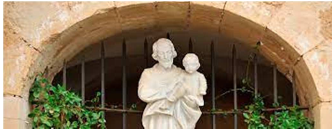
Monastère Saint-Joseph du Bessillon à Cotignac

Dans sa dernière lettre apostolique, « Patris corde » -avec un cœur de père, le pape François nous donne Saint Joseph comme « soutien et guide dans les moments de difficultés. » Tout au long de l'année, nous découvrirons les différentes facettes de cette « figure extraordinaire » : ce descendant de David à qui Dieu va confier la Vierge Marie et son fils Jésus.